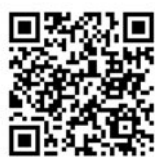
En la misma honda