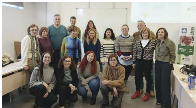
La red de familias es una de las más veteranas

La Federación ha celebrado 16 reuniones de diferentes redes profesionales durante el mes de enero y febrero.