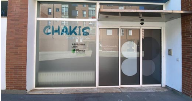
Fachada del centro Chakis de Asprona

Asprona León ha abierto un nuevo centro para personas con discapacidad intelectual el pasado 5 de marzo.