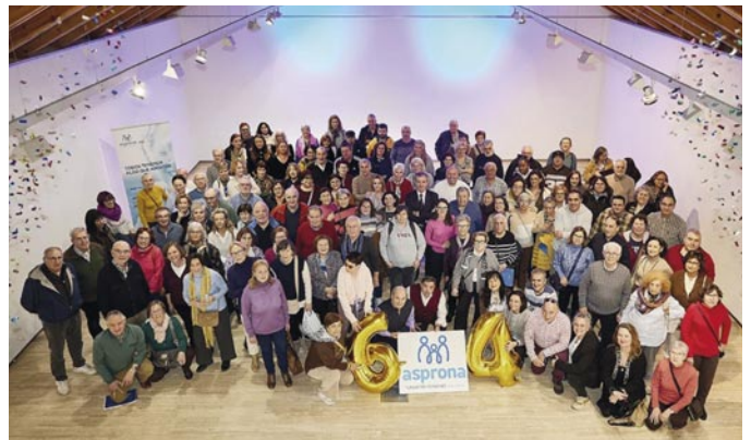
Foto de familia de todos los asistentes al aniversario de Asprona

Asprona Valladolid celebró el 10 de febrero su 64 aniversario y fueron 150 personas a la celebración.