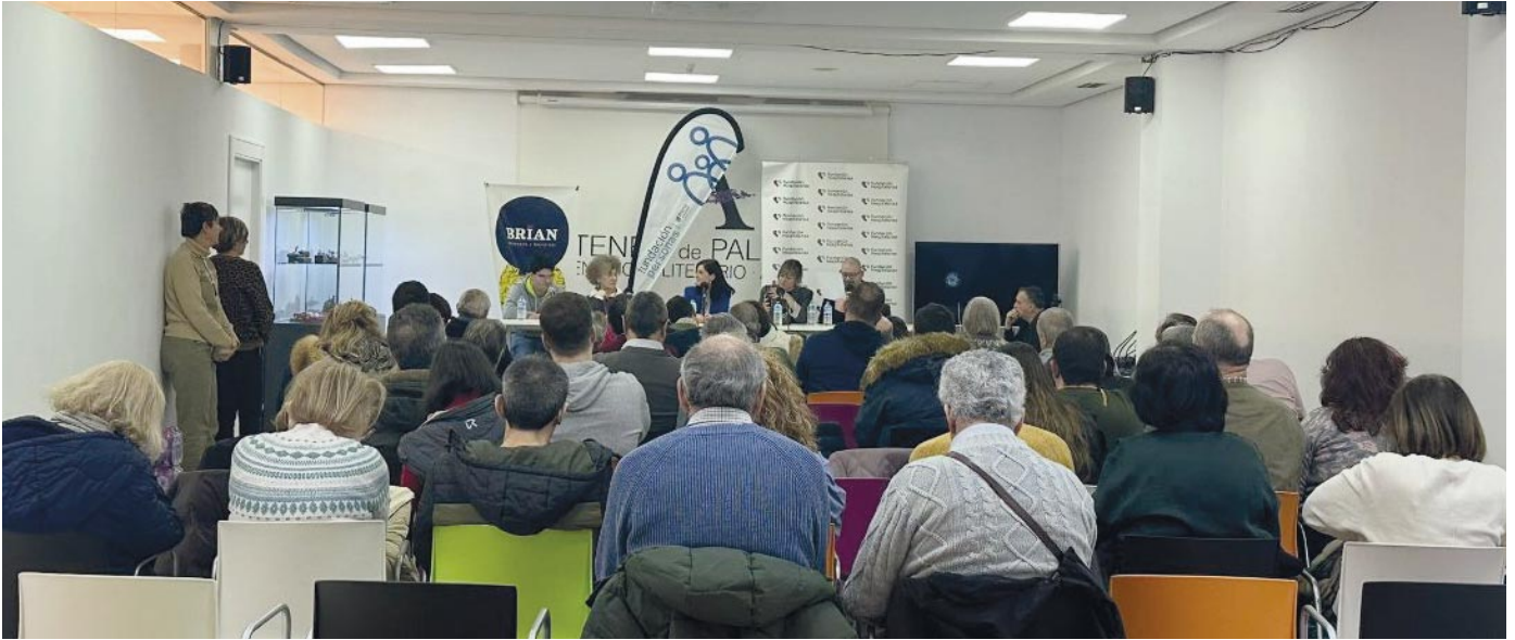
Decenas de personas disfrutaron del Maratón de Radio Inclusivo el pasado 13 de febrero en Palencia