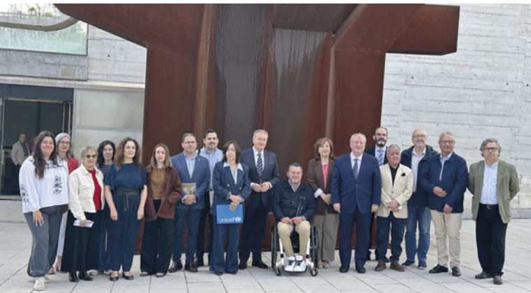
Todos los miembros del Grupo Enlace.

La Federación participó en una jornada del Consejo Económico y Social de Castilla y León para celebrar los 10 años del Grupo Enlace.