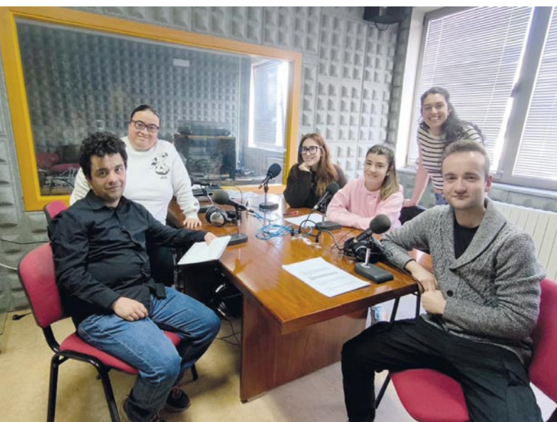
"Diversamente hablando" acerca temas universitarios a todas las personas de forma cercana y accesible