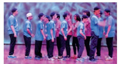
Una de las actuaciones

Sueños era el nombre de la Gala y fueron más de 600 personas a ver el espectáculo al auditorio Ciudad de León.