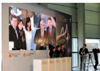
Arriba premio BBVA, abajo el del Ayuntamiento.

Aspanias recibirá por este premio 150.000 euros que dedicará a crear más empleo. Fundación Personas Grupo Lince ha ganado también uno de categoría inferior con un premio de 25.000 euros.