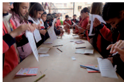
Los niños en las actividades de calle

El acto más importante de esta campaña es el “aula en la calle”