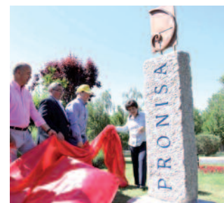
El Alcalde descubre el monolito

El Ayuntamiento de Avila ha dedicado una rotonda a PRONISA.