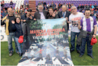
Presentación de la Marcha de Asprona Valladolid a la izquierda y la derecha multitud de andarines de la Marcha

Las marchas solidarias siguen siendo los actos que más gente mueven en cada ciudad