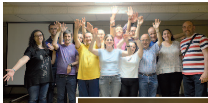
Alumnos de Fundación Personas y del Centro San Juan de Dios al finalizar uno de los talleres de comunicación. A la derecha, una de las actividades con el teatro de sombras para representar emociones y aptitudes.