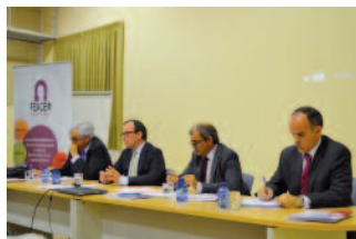
Inauguración de la Jornada