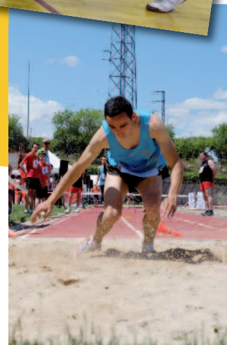
Algunos momentos de la competición y la entrega de las medallas en la Escuela de Policía de Ávila