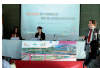
Presentación de la Guía en Valladolid.

Cada capítulo explica cómo se puede mejorar la comunicación y tienen consejos de profesionales de la televisión, de las redes