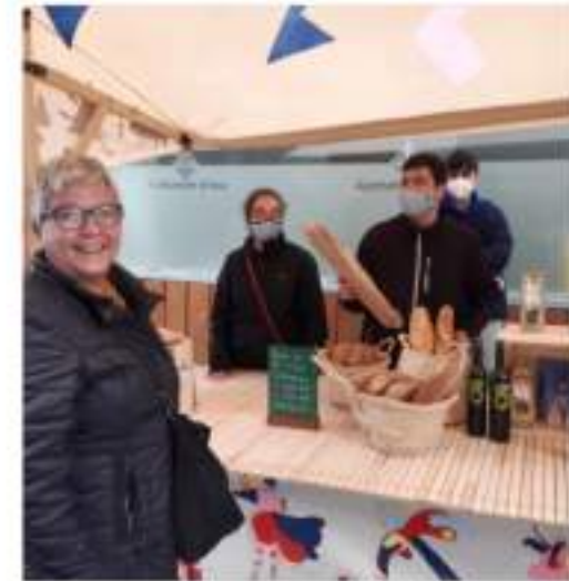
Dies de Fira i Mercat