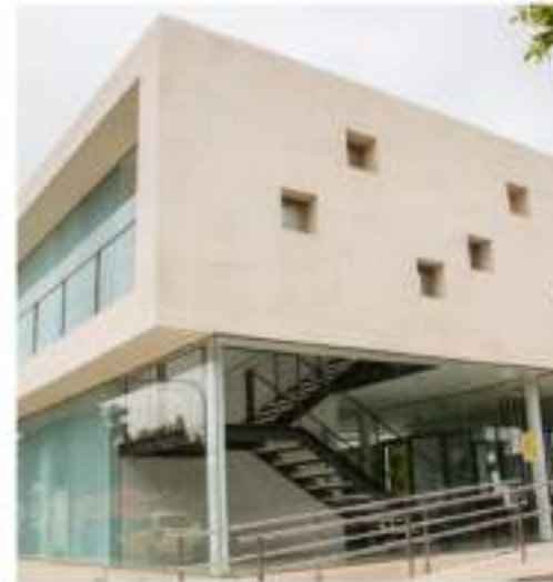
Dinamización barrios – Casales